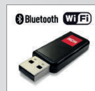
USB Connection Dongle USB combo Wi-Fi Bluetooth